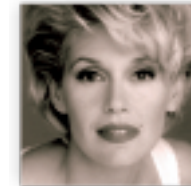
Maria Teresa Ruta conduce la diretta televisiva in mondovisione